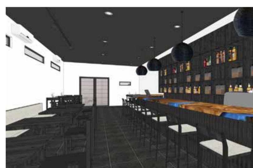
ムイネー 日本食レストラン