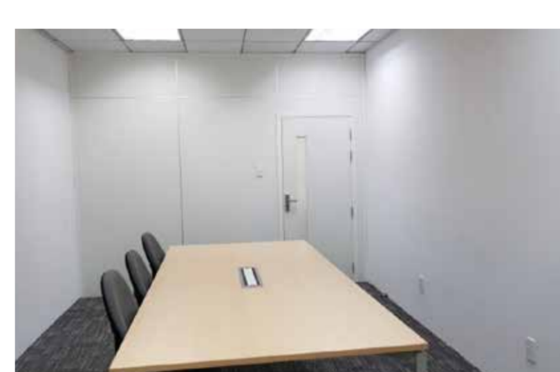
ホーチミン市1区 オフィスビル内会議室