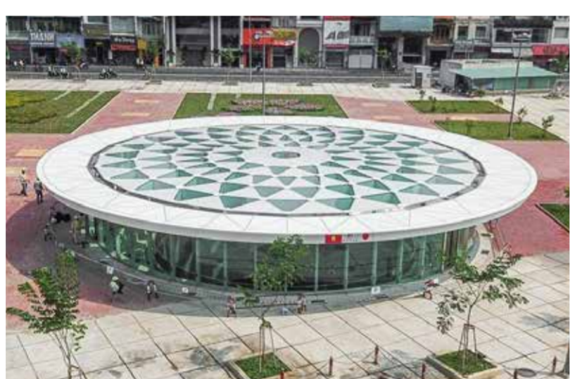
ホーチミン市 地下鉄バンタイン駅