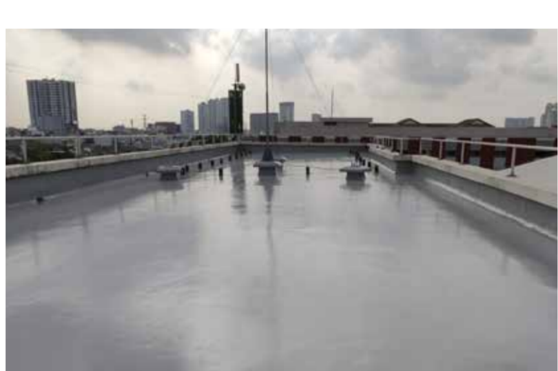
ホーチミン市7区 日本人学校