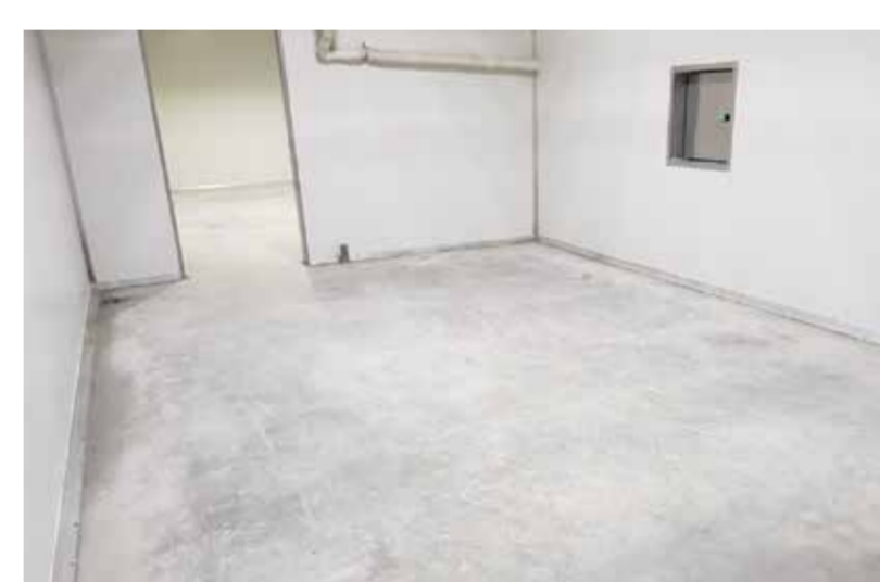
ホーチミン市 Tan Tao IP 食品工場