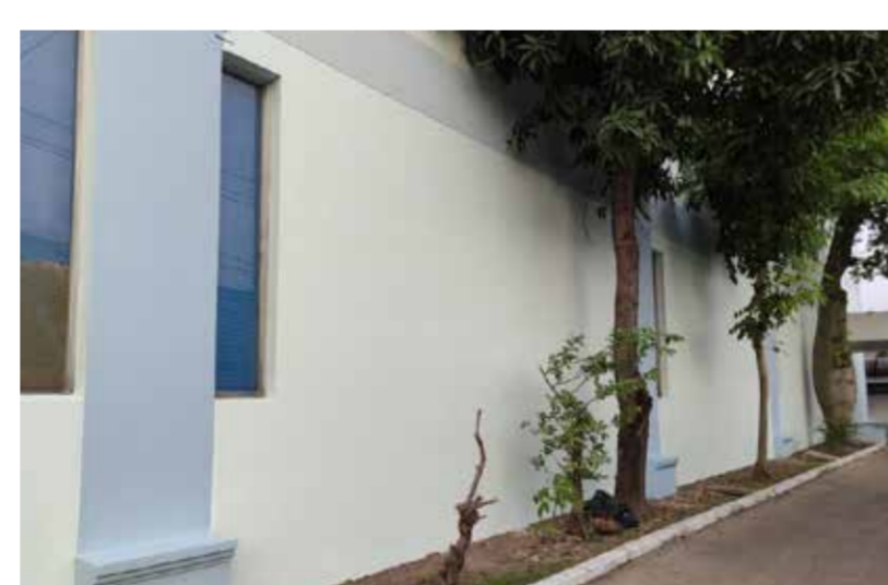
ホーチミン市 Tan Thuan EPZ 精密機器部品工場