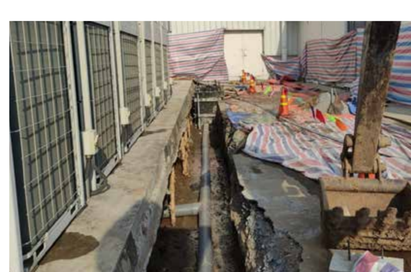
ニャーベ郡 Hiep Phuoc IP 製造工場