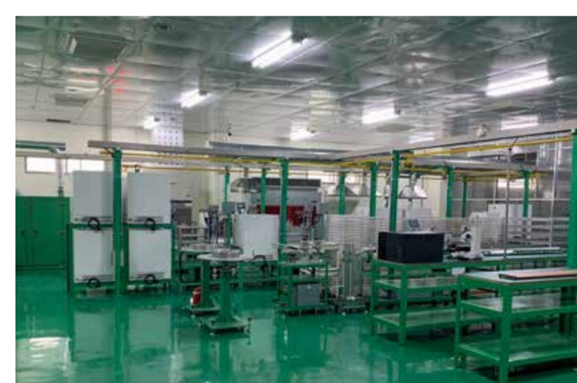
ビンズン省 VSIP2 IP 機械部品工場