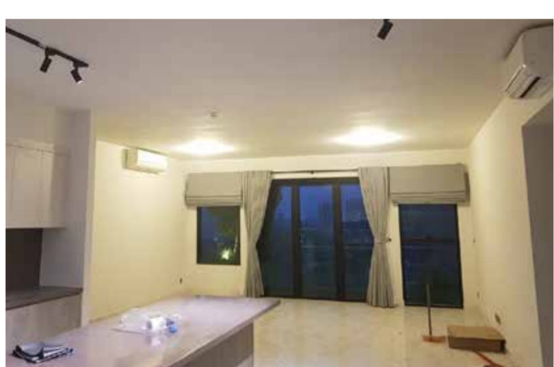
ホーチミン市2区 マンション 個人様住居